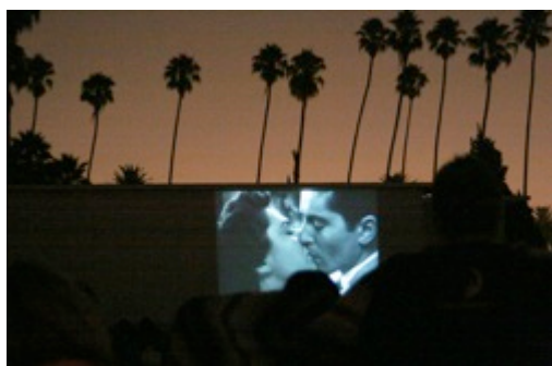
Cinema sotto le stelle o cinema al fresco?

Le sculture di Vittore Frattini , che in queste settimane hanno impreziosito il contesto di Villa Recalcati, rimarranno esposte e visitabili dal pubblico per tutta estate. Sarà una mostra open space, dal momento che la parte esposta nelle sale è stata smontata lo scorso 13 luglio, data di chiusura dell'evento. Visto però il buon successo di pubblico e l'apprezzamento del contesto ambientale, che ben si armonizza con quello artistico, è stato deciso di prolungare per tutta l'estate l'esposizione delle sculture all'aperto.