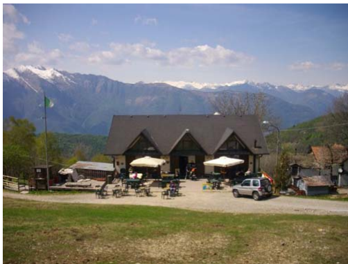
Settima festa di fine estate al Passo della Forcola.

Sul lago di Comabbio, al Parco Berrini di Ternate , la 4° edizione della Festa del Pescatore , organizzata dai pescatori locali. Il programma prevede musica dal vivo, stand gastronomico con specialità di pesce: fritto misto, trota in carpione, alborelle, rane fritte etc..e per chi non ama i piatti di pesce:costate, salamelle,patatine fritte etc. Per dissetarsi: birra alla spina, bibite,vino.