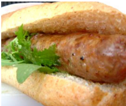
Feste e sagre

Nonostante le previsioni meteo del fine settimana non siano proprio rosee – sabato sarà variabile, domenica il cielo sarà nuvoloso e più fresco – non si può certo dire che l'estate non sia arrivata. La scuola è ormai finita, gli esami o le vacanze sono alle porte, le feste e le sagre impazzano come da tradizione. Per non parlare poi del fatto che sabato sera la festa potrebbe essere davvero grande a Varese: dopo 37 anni la città intera si potrebbe infatti riversare in piazza. Per scaramanzia non diciamo il percome e il perché.....ma se succederà la festa sarà davvero grande e le arterie e le piazze della città non basteranno per contenere la gioia dei tifosi biancorossi!